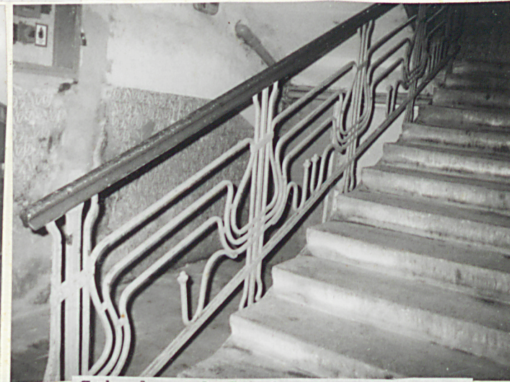
Schody - balustrada metalowa.