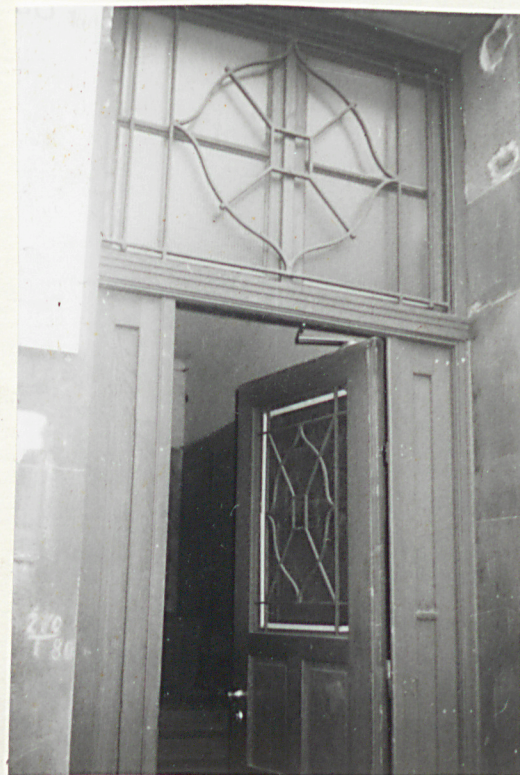
Elewacja frontowa-wschodnia. Stolarka wejścia głównego.