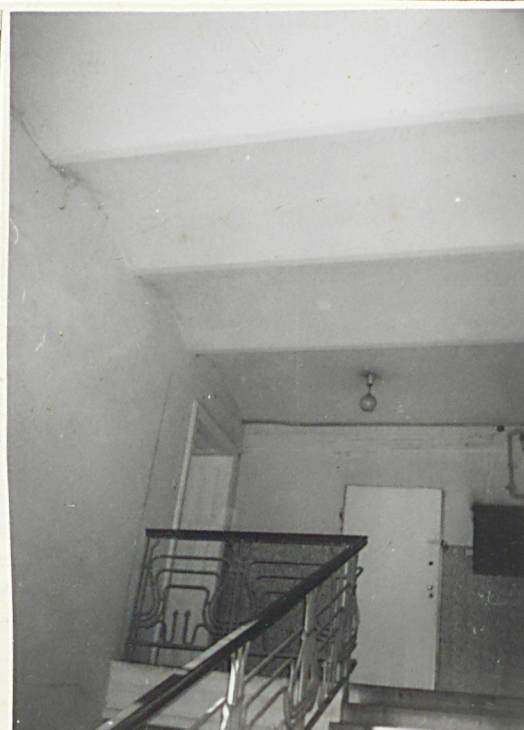
Klatka schodowa - strop.