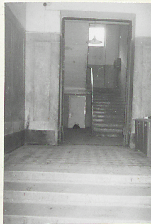
Hol wejściowy z widokiem na klatkę schodową.