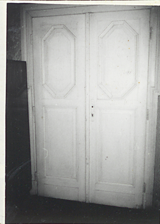
Stolarka drzwiowa (zewn.).