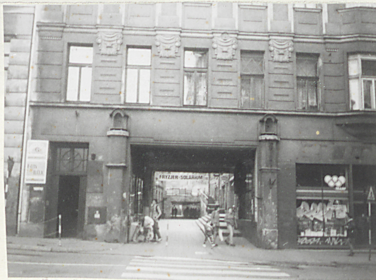
Elewacja frontowa - przechód.