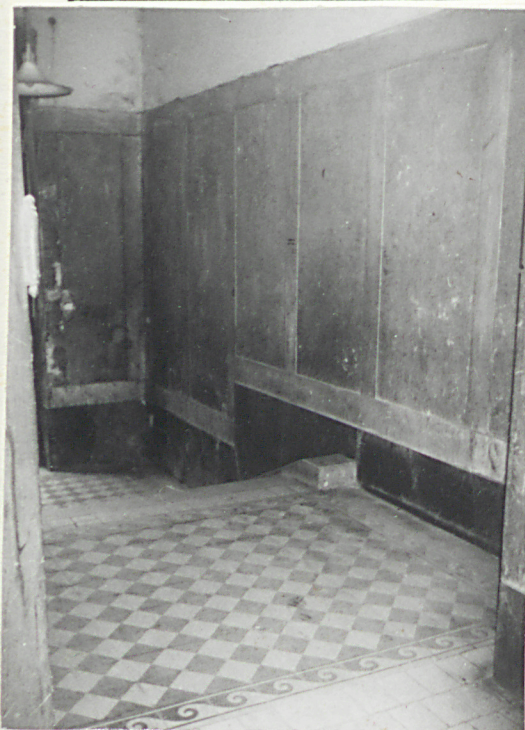
Hol wejściowy (pion komunikacyjny) - posadzka ceramiczna. Boazeria marmurowa.

O p i s - ciąg dalszy poz.13 (ul.Barlickiego 1/ul.Przechód 1)