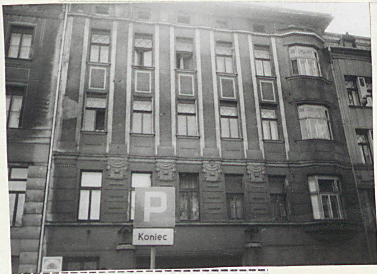
Elewacja frontowa (wsch.). Wystrój architektoniczny.