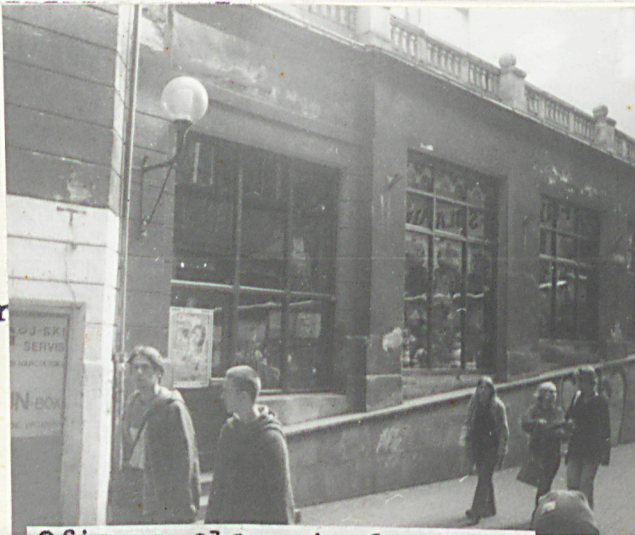
Oficyna - elewacja frontowa.

Druk. Bytom, ul. Piłsudskiego 37, tel. 817-091, zam. 463-94, n. 2000