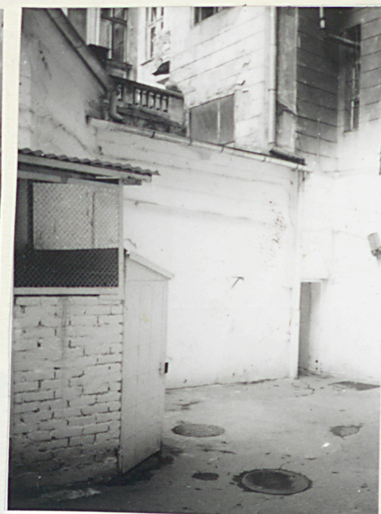
Elewacja zachodnia, ryzalit komunikacyjny, skrzydło zachodnie - podwórze.