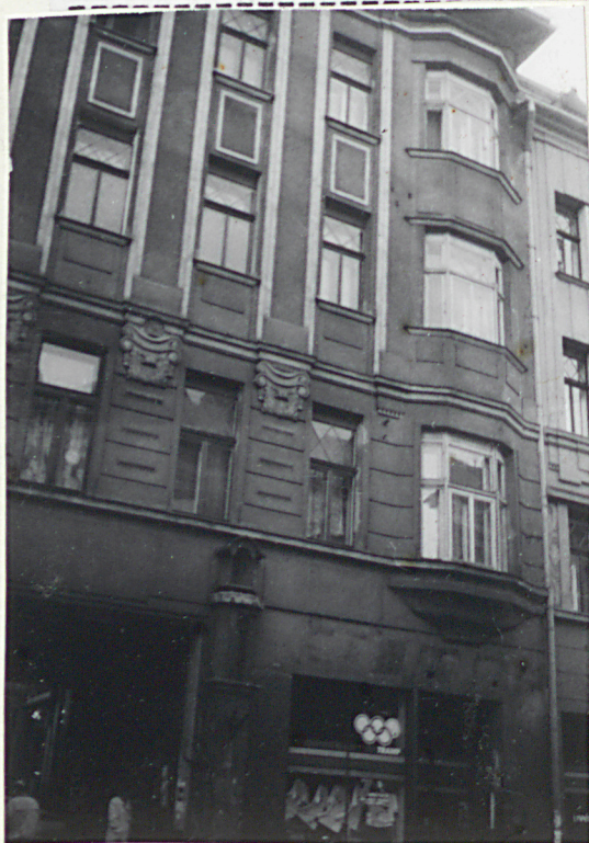
Elewacja frontowa- wykusz