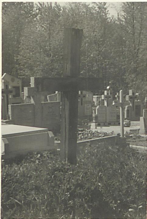
Grób żołnierzy z 1914r.