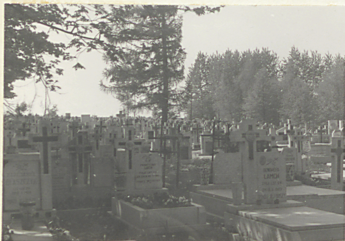
Wnętrze cmentarza, Część zach.