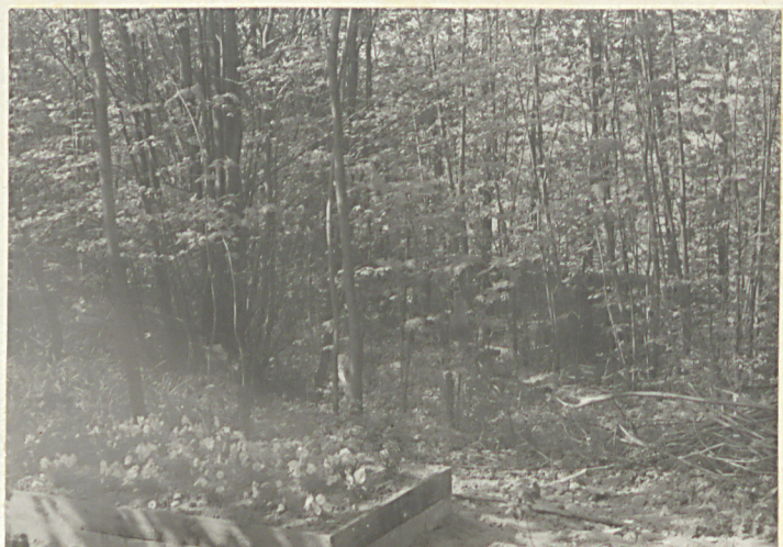
Wnętrze cmentarza, część pn-zach.