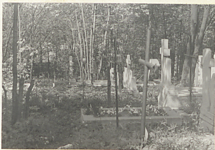
Wnętrze cmentarza, część pn.