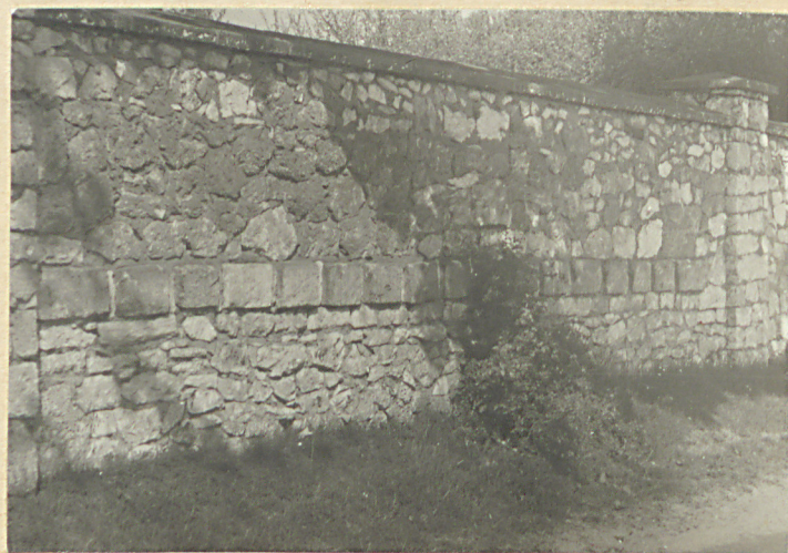
Kamienie z nazwiskami murarzy, którzy zbudowali mur.