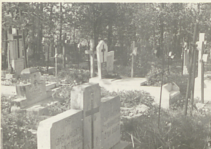
Wnętrze cmentarza, część pn-wsch.