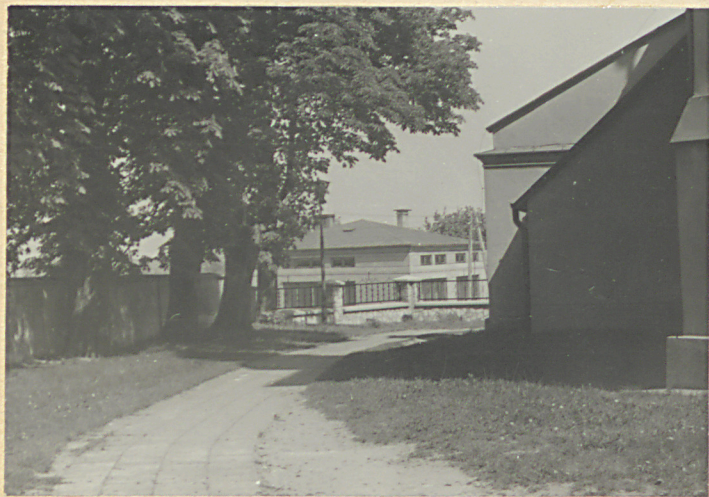
Wnętrze cmentarza, część pd-zach