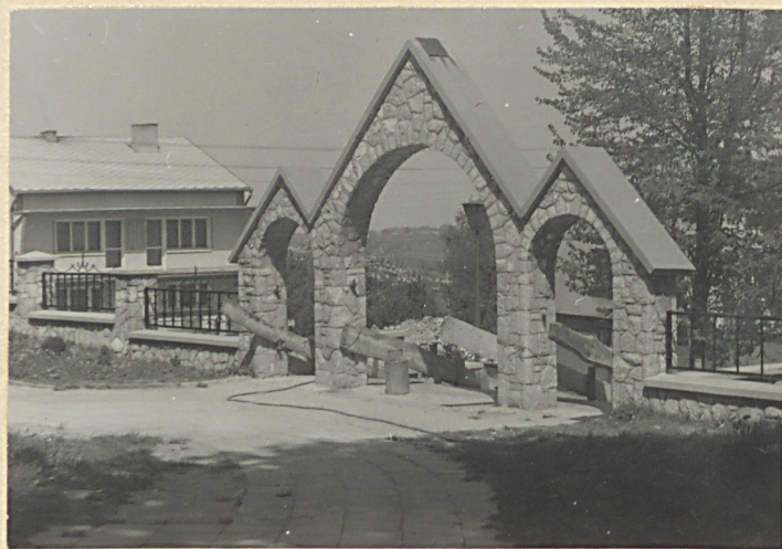
Wnętrze cmentarza, część zach.