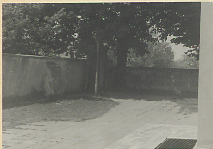
Wnętrze cmentarza, część pd-wsch.