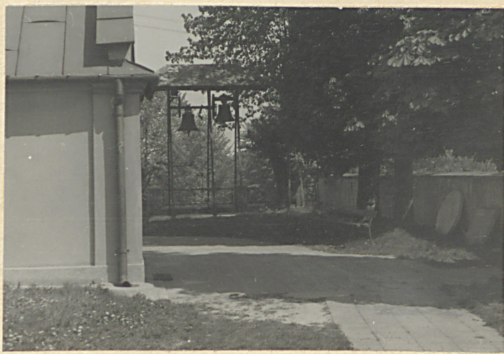
Wnętrze cmentarza, część pn-zach.