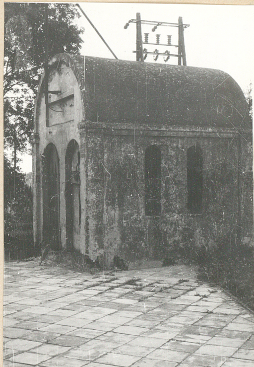
Kaplica grobowa sprzed 1939 r.