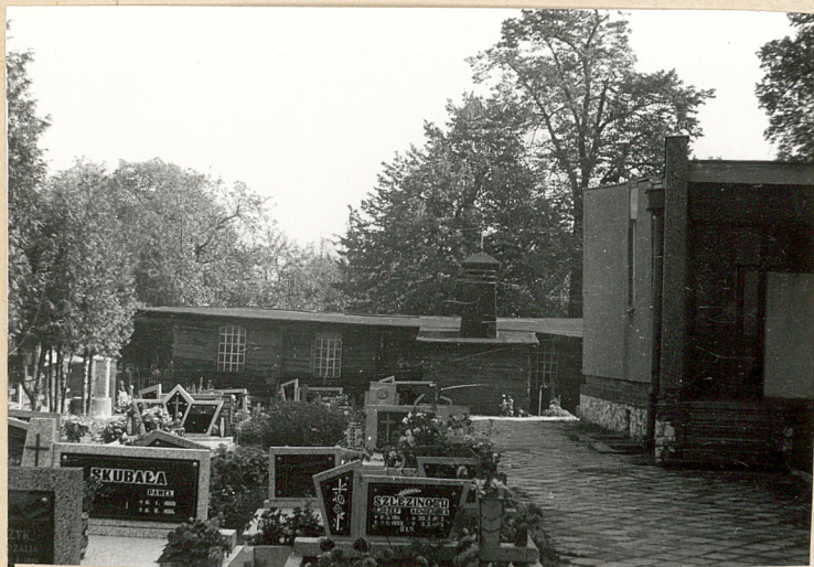
Barak drewniany wybudowany w 1961 r. - po spaleniu się kościoła