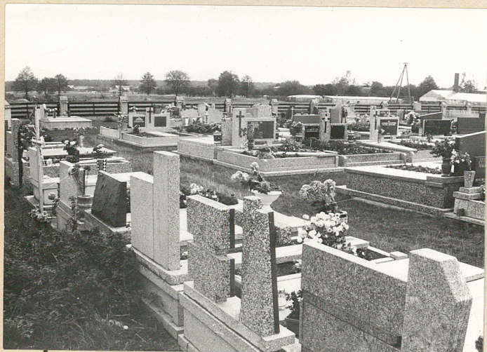
3. WNETRZE CMENTARZA