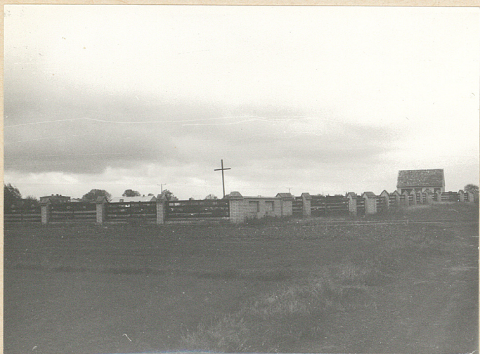
1. WIDOK NA CMENTARZ OD STRONY WSCHODNIEJ