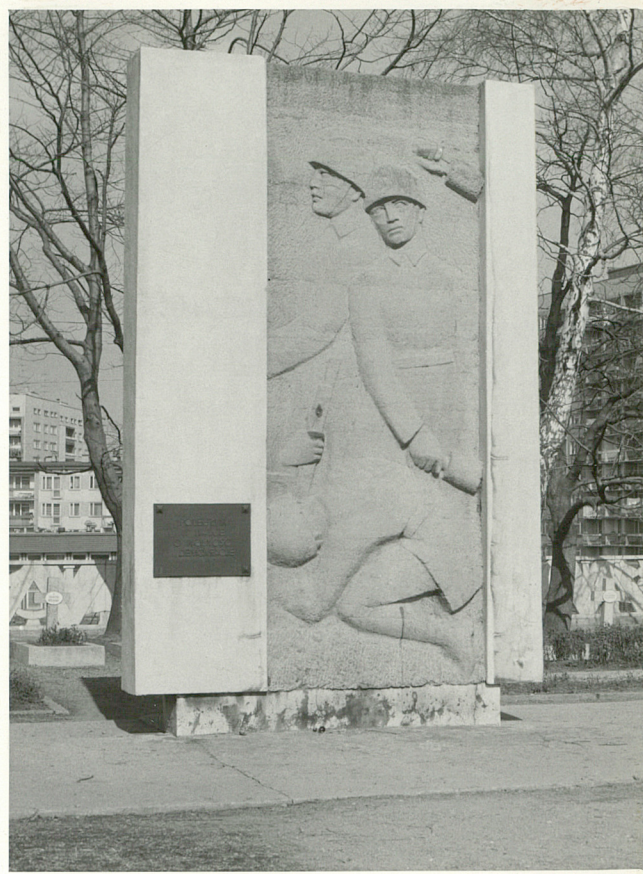
3. Pomnik bohaterów wojny proj.