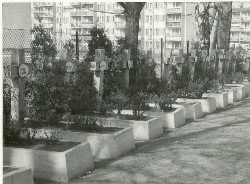
4. Kwatera mogił żołnierskich