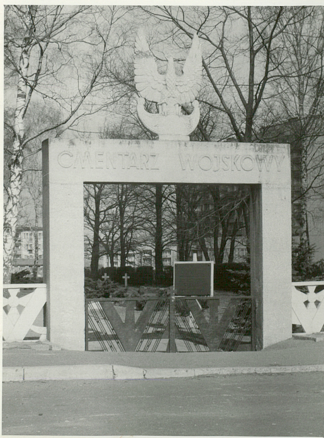
2. Brama cmentarza