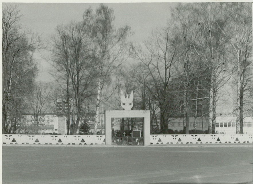
1. Położenie cmentarza wśród osiedla

Urząd Miasta w Bielsku-Białej Osiedle Wojska Polskiego Cmentarz Wojskowy 0,36 ha brak domu przedpogrzebowego