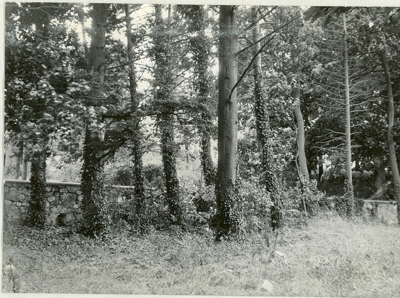
FOT. 3 - GABINO - Park Pomryte bluszczem paie szierkone