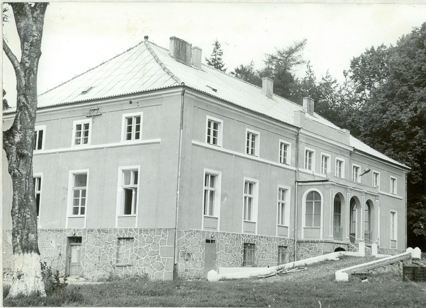
FIG. 1 - CABINO - Park Palace