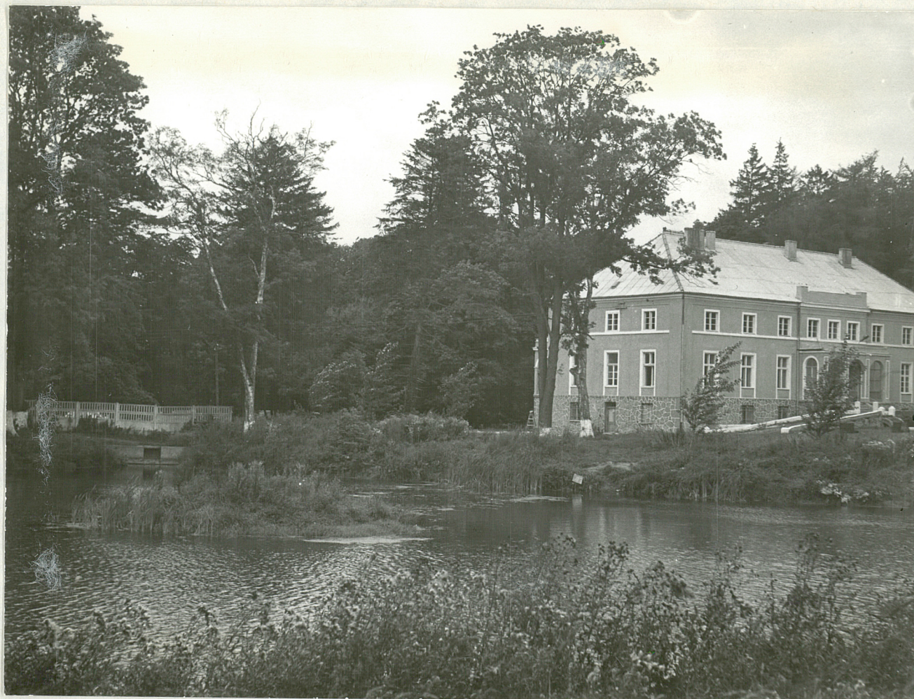
FOT. 4 - GABINO - Park widok pałacu, na pierwszemu planie staw