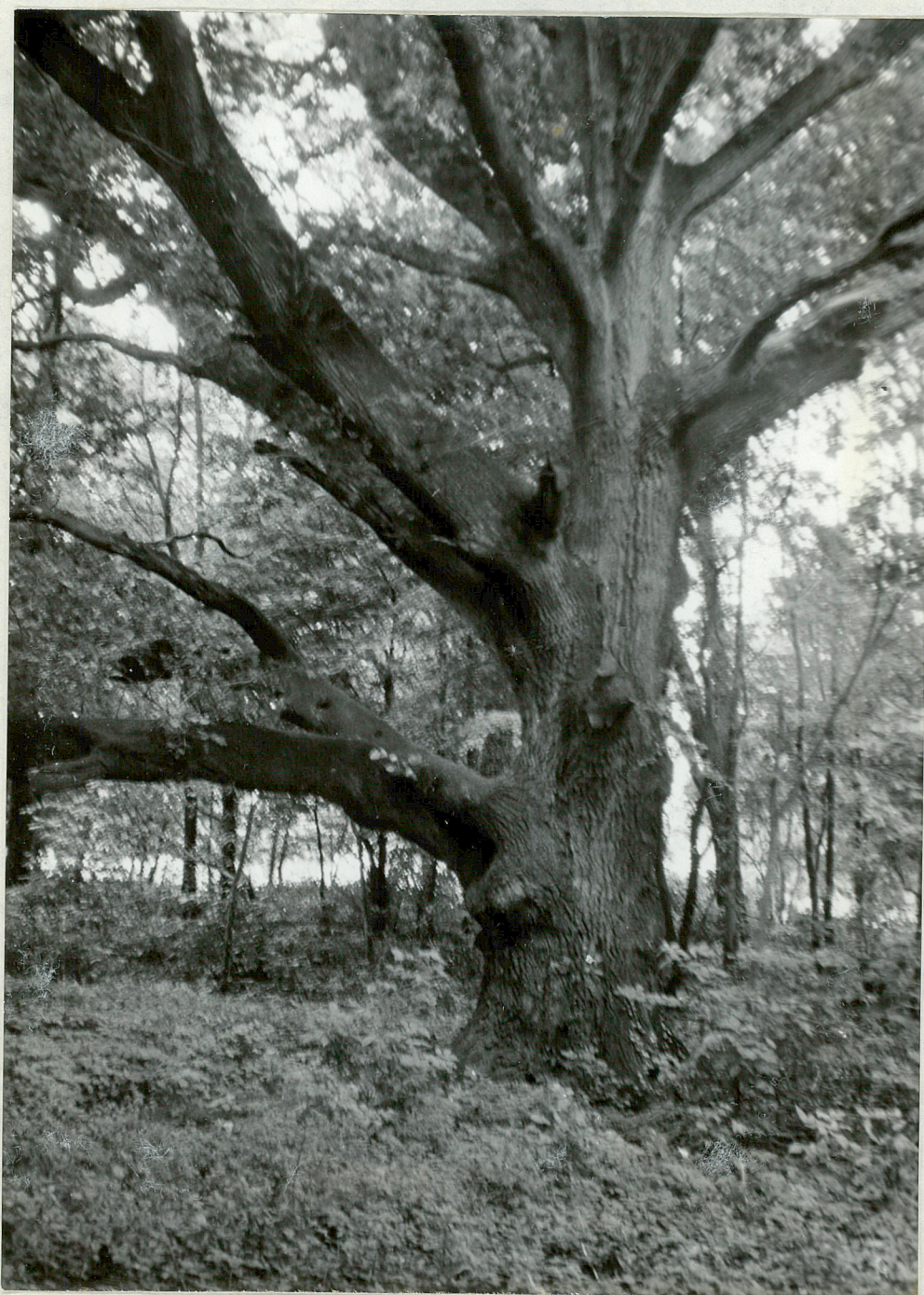
FOT. 5 - GABINO - Park

Pień 1 konary poaniłowanego dębu szypułkowego