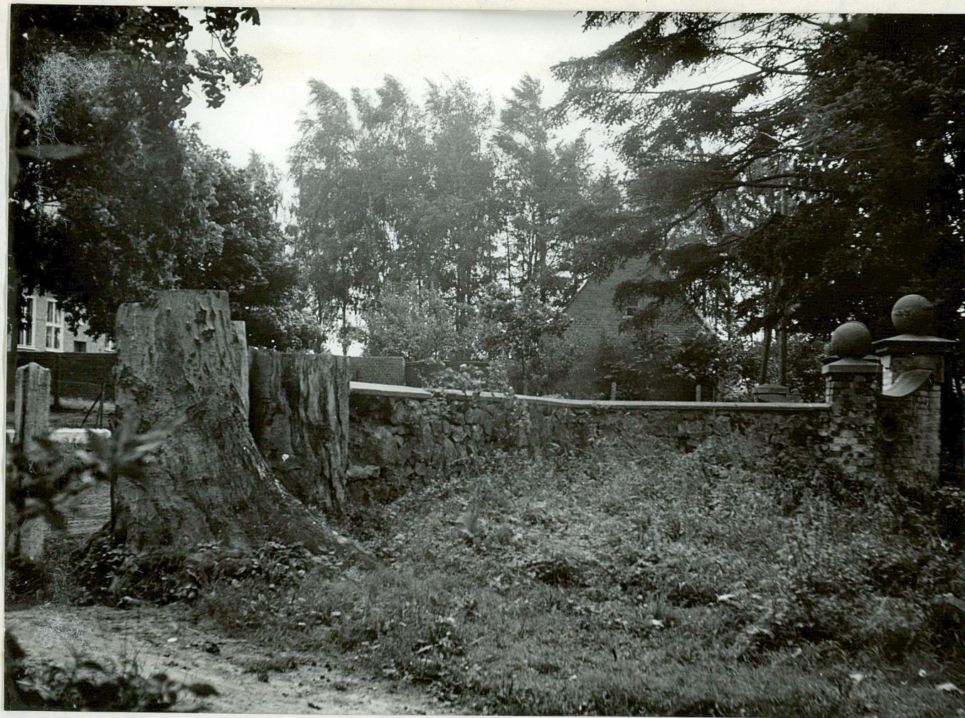
FOT. 2 - GABINO - Park Ścięty pień potężnego drzewa