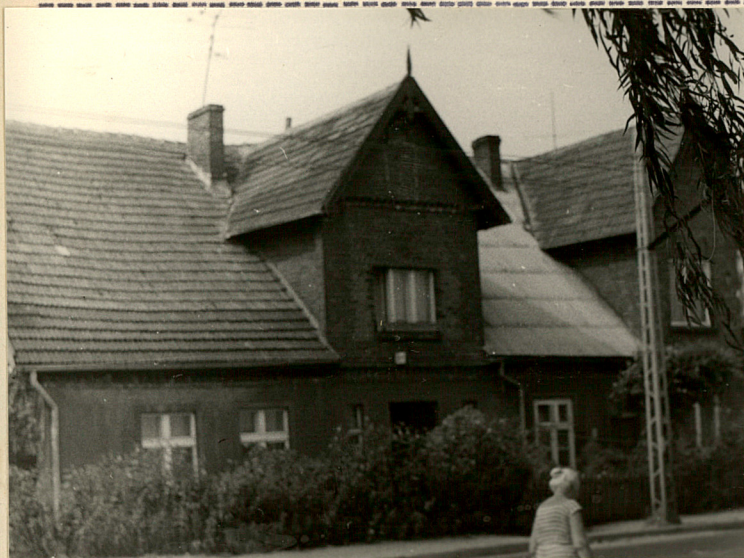
Elewacja wsch. - część z 1924 r.