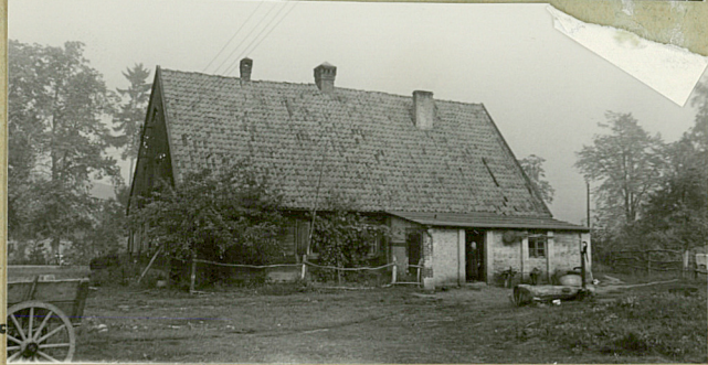
STAN W 1964r.