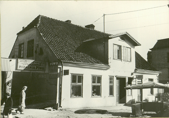
ul. Bohaterów Monte Cassino

Na rzucie prostokąta, 1-kondygnacyjny z wystawką. kryty dachem naczółkowym.