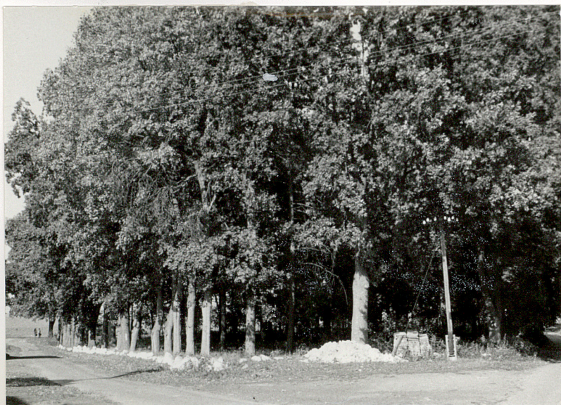
Sokole, gm. nieczajny 1. Drzewostan omentarny