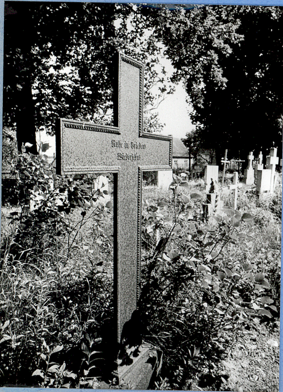
3. Groby rzym-kat. z żeliwnym krzyżem