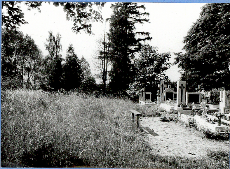
2. Widok z grobami rzym-kat.