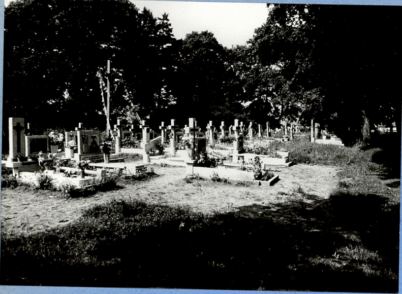
1. Widok ogólny cmentarza