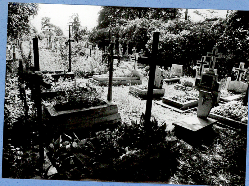
4. Groby rzymsko-katolickie