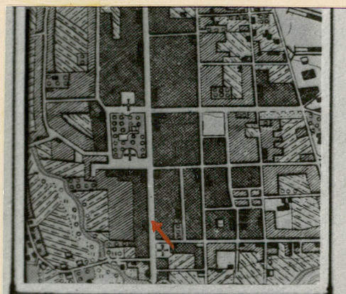
Plan orientacyjny Suwałk podz. 1:25.000

autor zdjęć data wykonania miejsce przechowywania negatywów