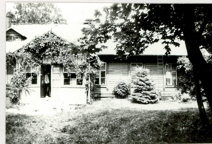
Fragment el. południowej