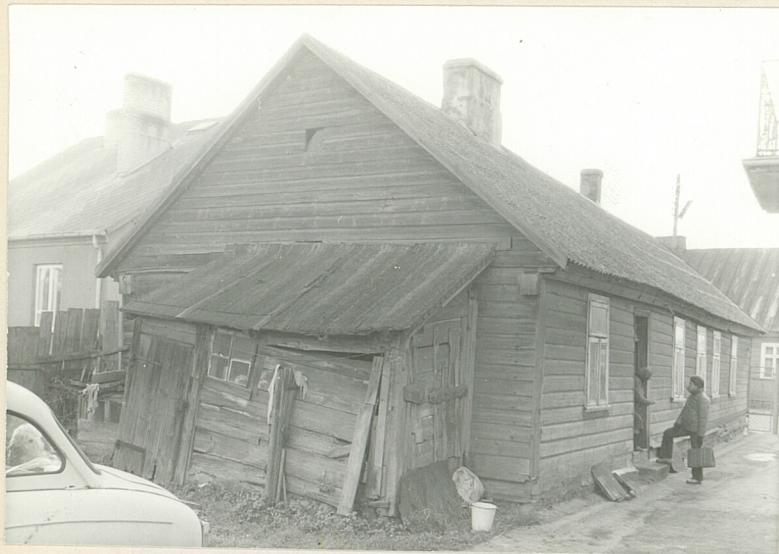
1. Widok z głębi podwórza