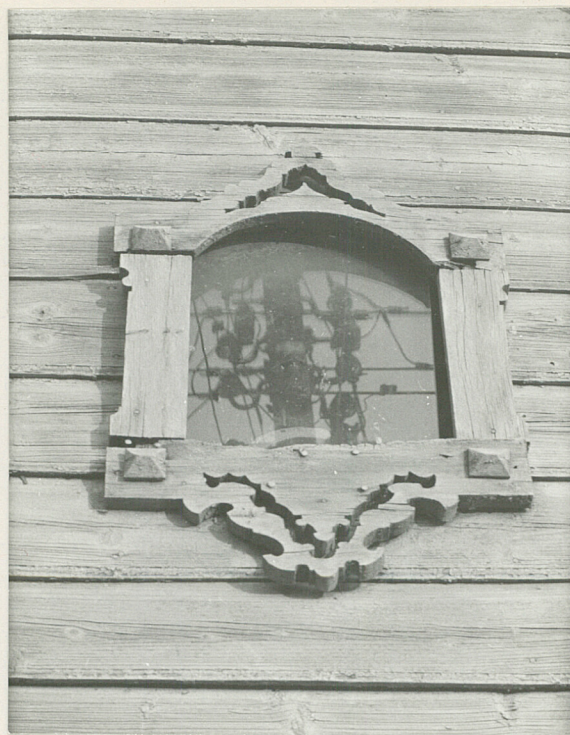
2. Okienko w szczycie od strony zach.