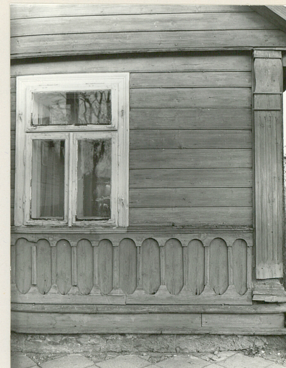
3. Fragment szalunku w elewacji północnej