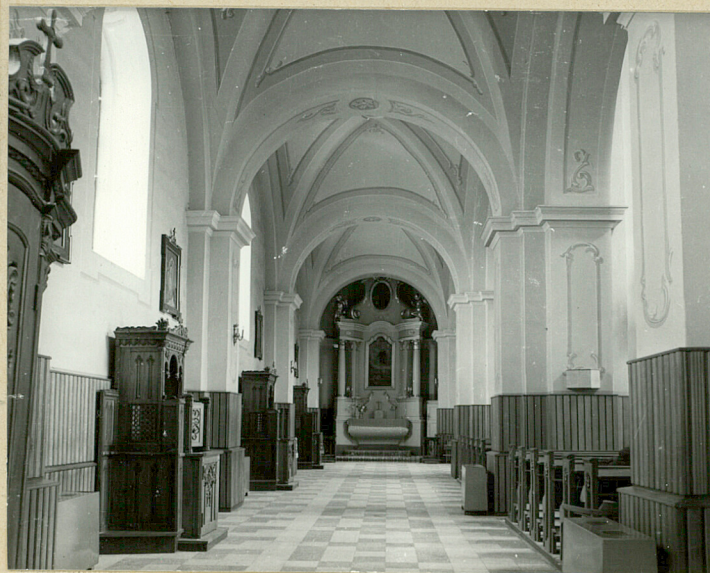
nawa boczna wsch.