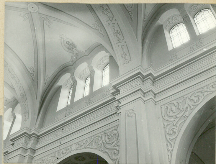
belkowanie i fragm. sklepienia nawy głównej