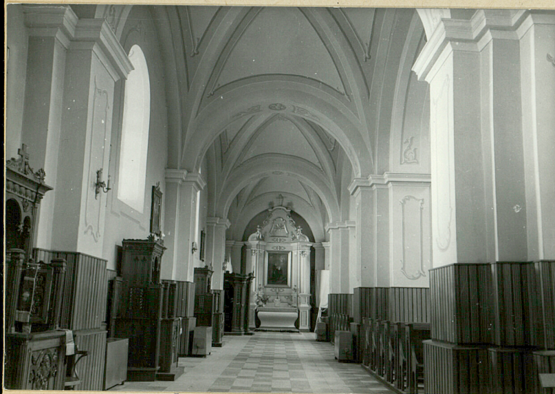
nawa boczna zach.