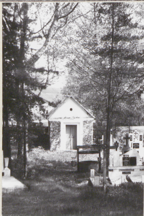
Widok ogólny od płd-zach.