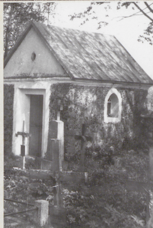
Widok od płd.