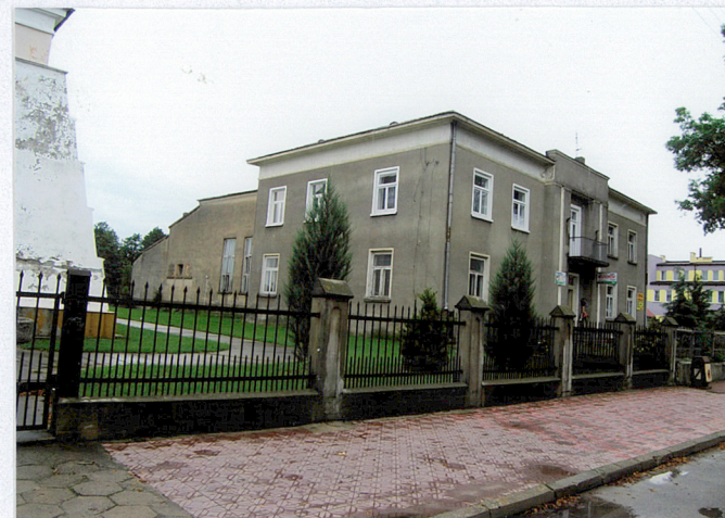
Elewacja północno zachodnia i południowo zachodnia