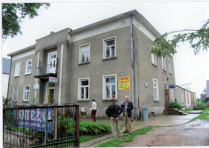
Elewacja południowo zachodnia i południowo wschodnia