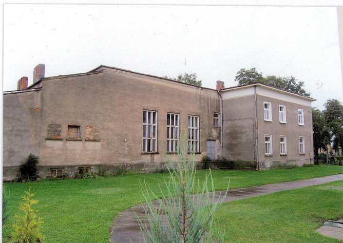
Elewacja północno zachodnia