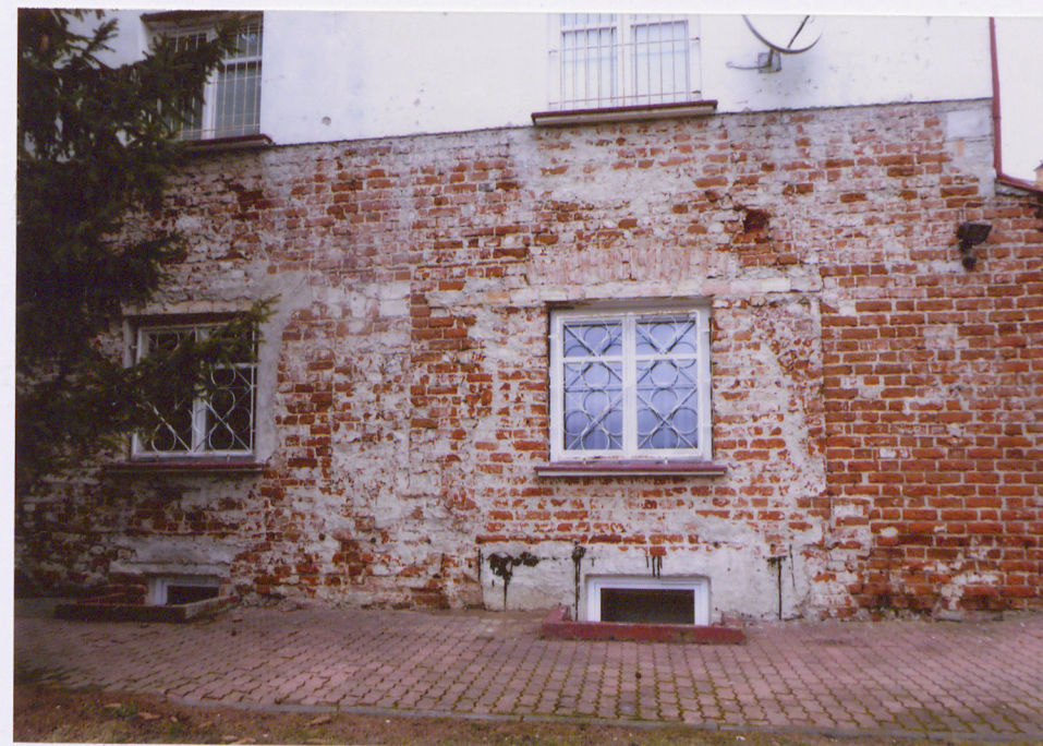
Fragment elewacji południowej

Opracowanie załącznika: mgr Katarzyna Niedźwiecka (data i podpis) 27 maja 2020 r.