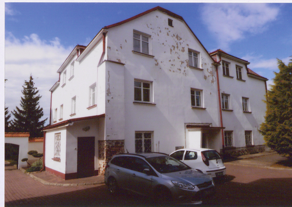
Widok na elewację północną i elewację wschodnią

Opracowanie załącznika: mgr Katarzyna Niedźwiecka (data i podpis) 27 maja 2020 r.