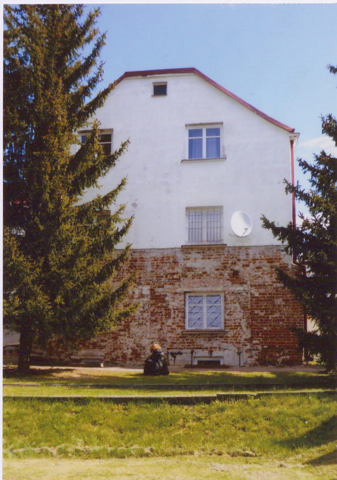
Widok na elewację południową