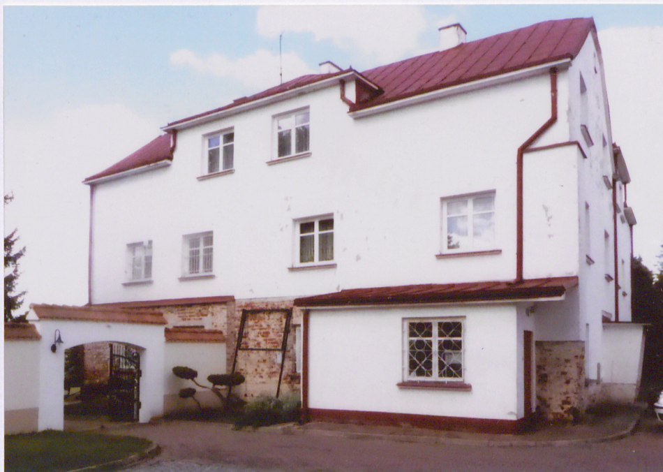
Widok na elewację wschodnią i elewację północną