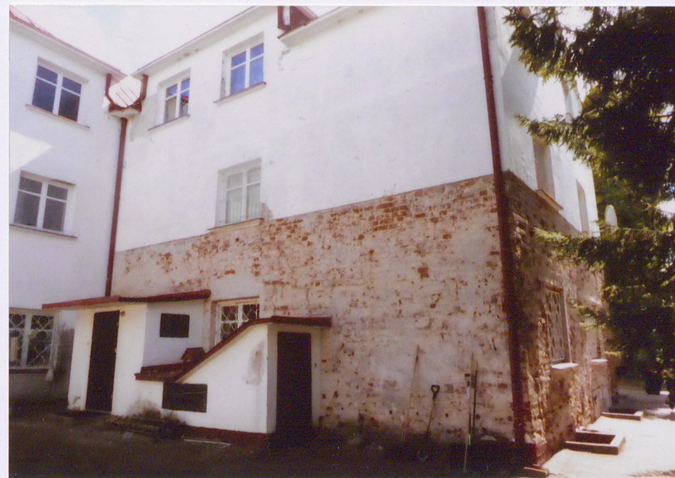
Widok na elewację zachodnią

Opracowanie załącznika: mgr Katarzyna Niedźwiecka (data i podpis) 27 maja 2020 r.