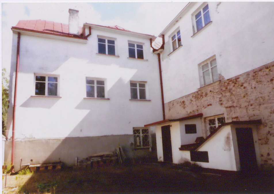
Widok na elewację południową i fragment elewacji zachodniej