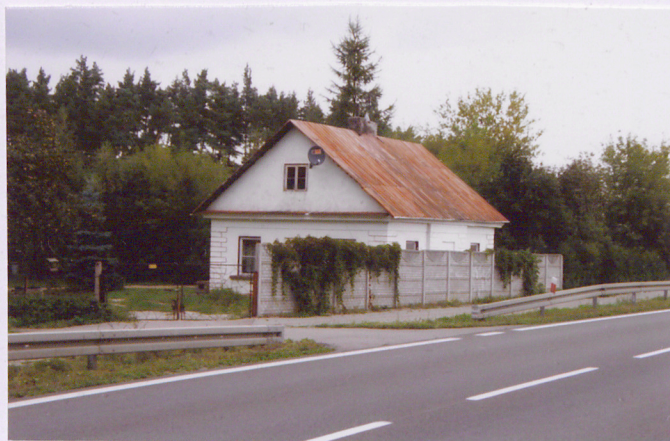
Elewacja południowo – wschodnia i południowo – zachodnia

11. Zdjęcia , rzut , przekrój , sytuacja , orientacja