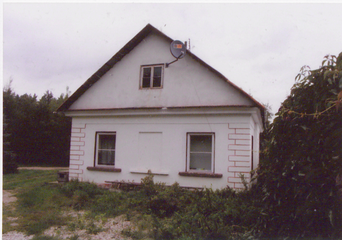
Elewacja północno – wschodnia