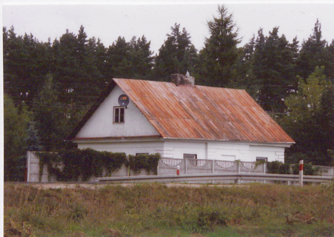
Elewacja południowo – wschodnia i południowo – zachodnia