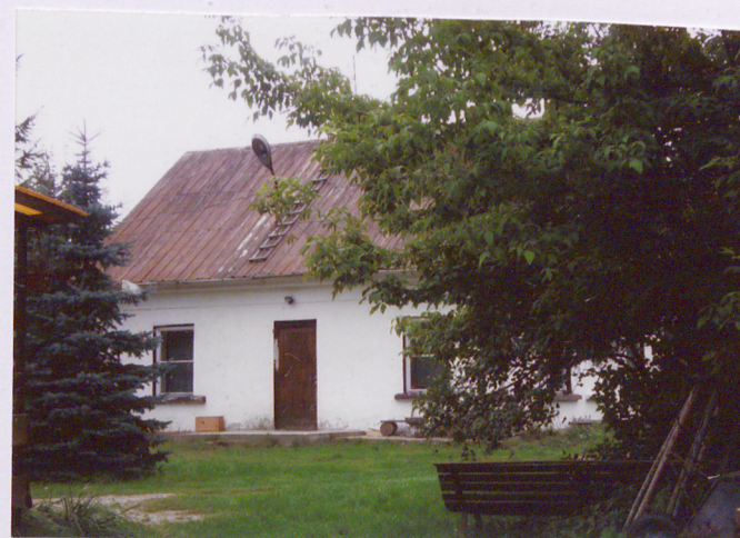
Elewacja północno – zachodnia