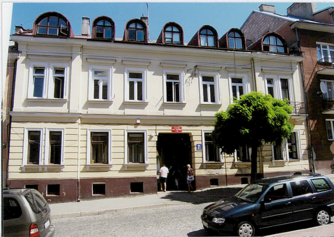
Fot. Elewacja frontowa - od ul. Dwornej

11. Zdjęcia, rzut, przekrój, sytuacja, orientacja