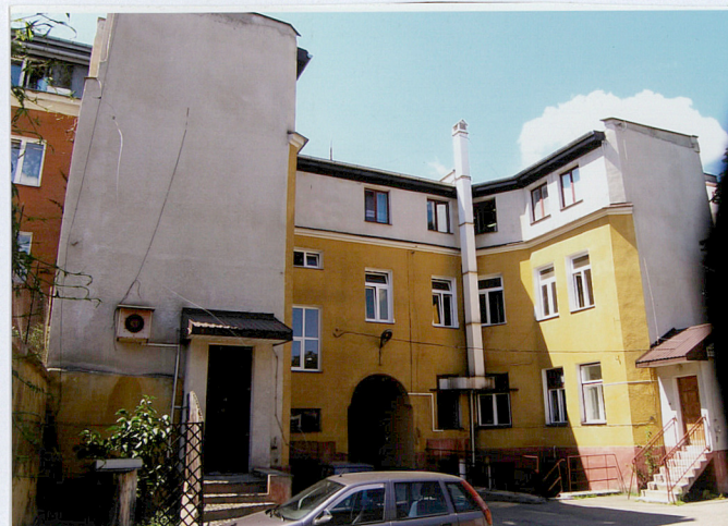
Fot. Widok od północy na elewację podwórzową

Wkładkę założył: Barbara Tomecka październik 2005r. (imię, nazwisko, data)