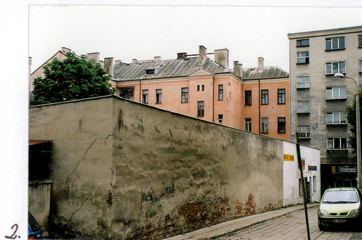
Wkładkę założył: Aneta Kułak wrzesień 2004 (imię, nazwisko, data)

Instalacje: wodociągowo-kanalizacyjna, elektryczna, ogrzewcza kominowo-pieczowa, w niektórych mieszkaniach co, na parterze alarmowa.