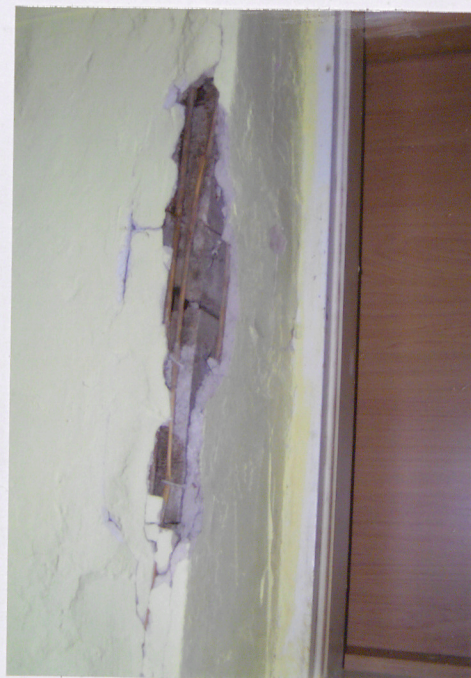
Fot. Fragment ściany z ubytkami w tynku - widoczny materiał budowlany