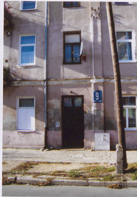
Fot. Fragment elewacji od ul. Bernatowicza