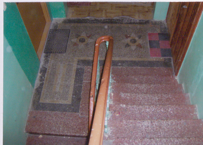
Fot. Posadzka na klatce schodowej