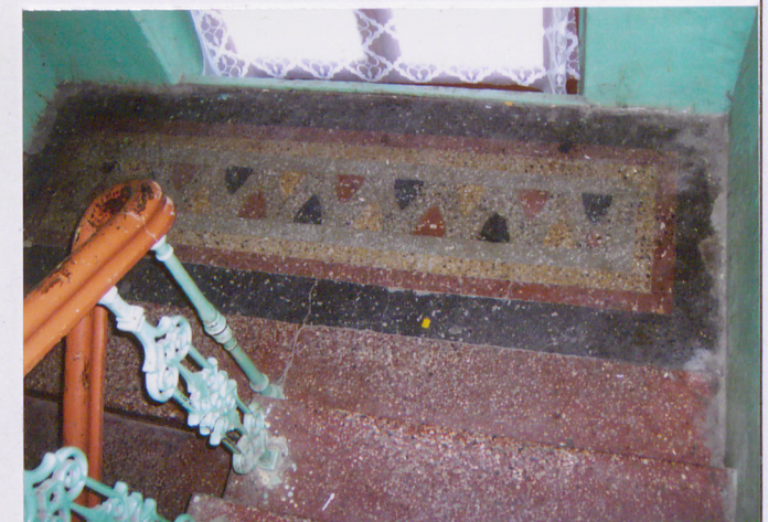
Fot. Posadzka na spoczniku - półpiętro

Wkładkę założył: Barbara Tomecka październik 2005r. (imię, nazwisko, data)