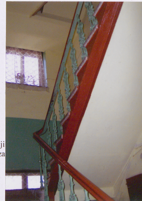
Fot. Balustrada schodów