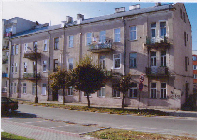
Fot. Widok ogólny od wschodu

11. Zdjęcia, rzut, przekrój, sytuacja, orientacja