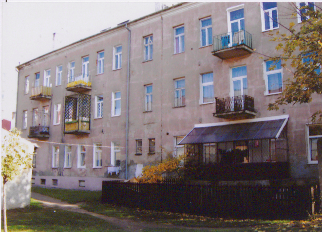
Fot. Elewacja płn.-zach. – tylna