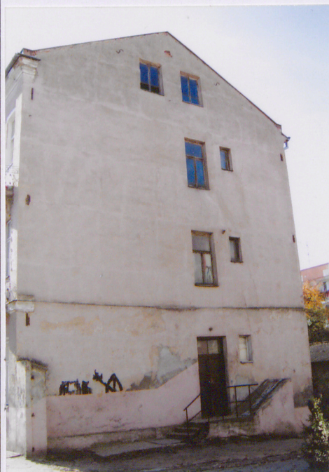
Fot. Elewacja szczytowa płn.-wsch.