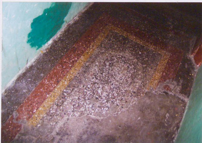
Fot. Posadzka na korytarzu