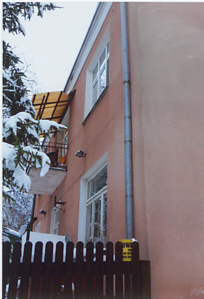
Elewacja tylna (południowo-zachodnia)