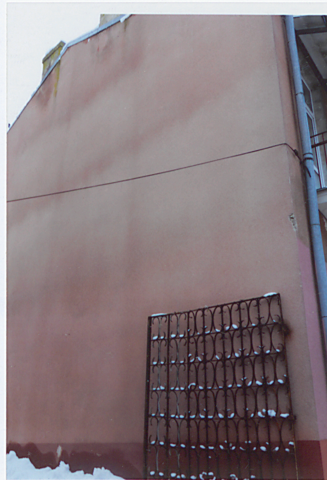
Elewacja szczytowa (południowo-wschodnia)