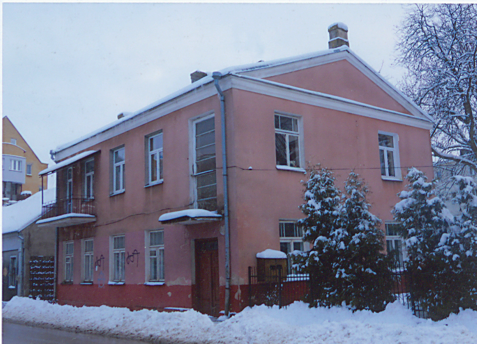
Widok ogólny od północnego-zachodu