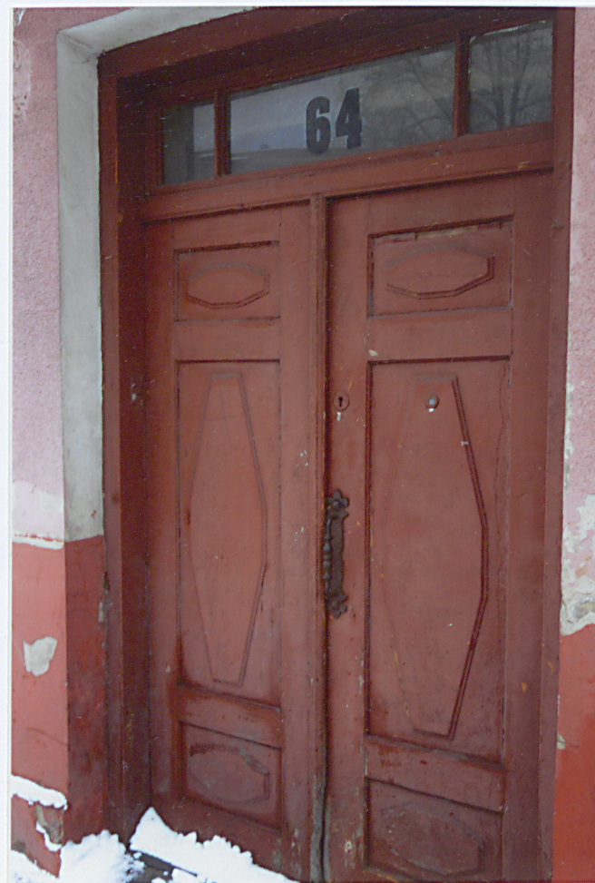
Stolarka drzwiowa (wejście główne)