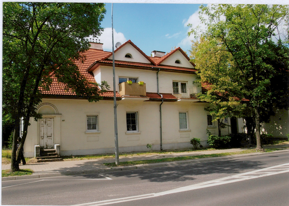
Elewacja frontowa – widok od południa.