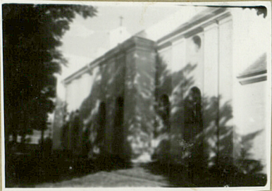
Koza S: Architekci i budownictwo w Polsce Warszawa 1954