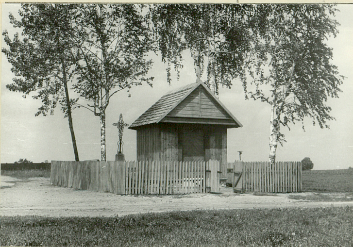
Widok ogólny z drogi