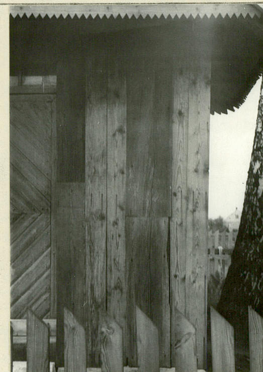
Fragment starego szalunku