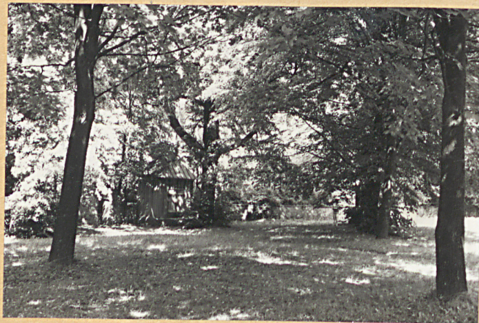
FOT. NR 3