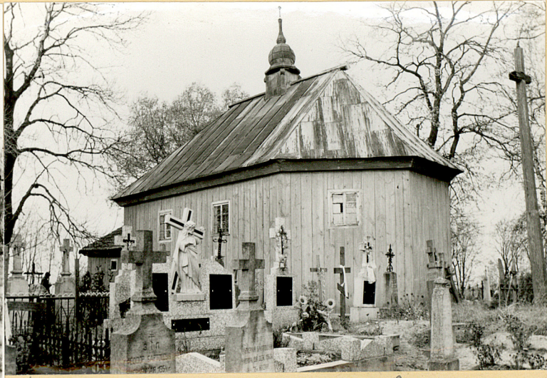
Kaplice cmentarna prolostańska p. S. Anny