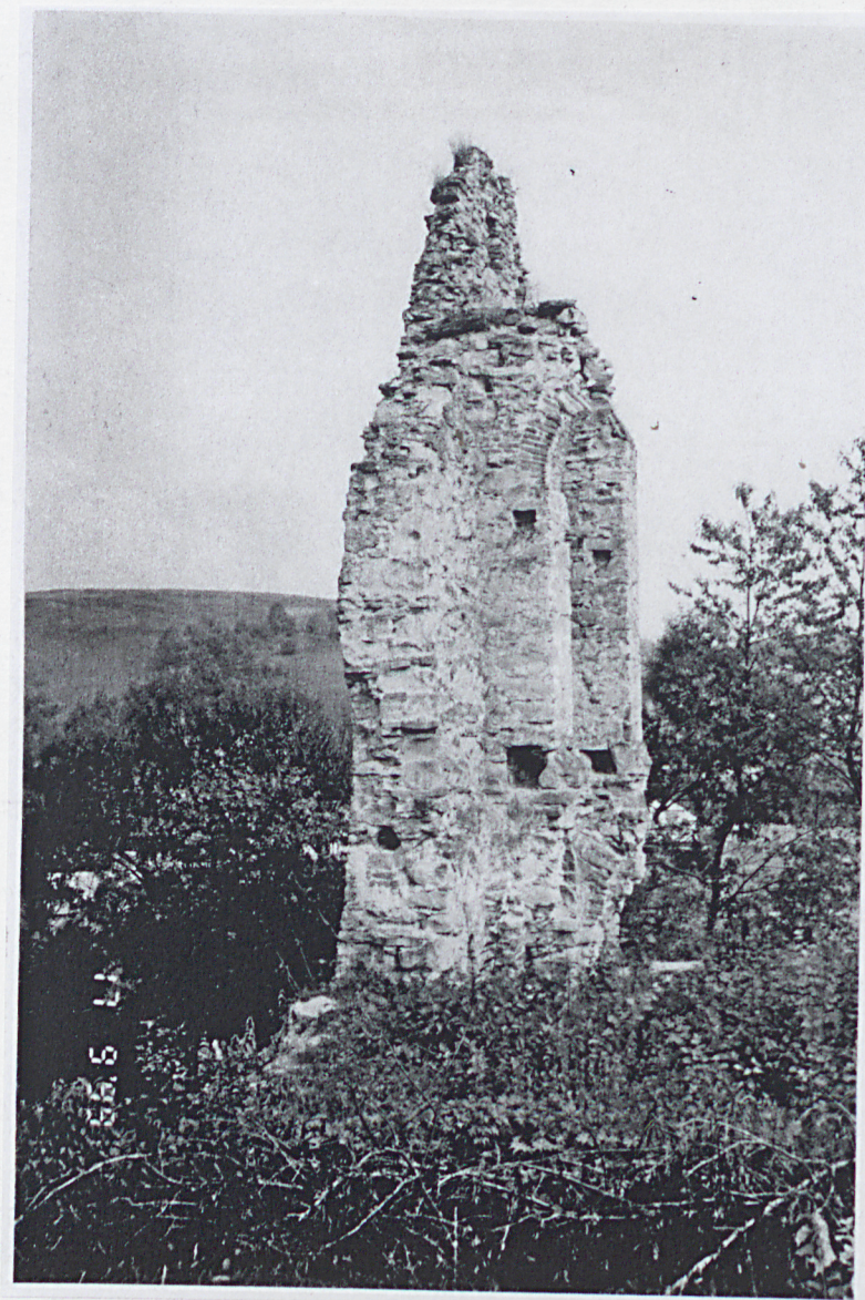
Szczegół zachowanej ściany budynku szpitala.