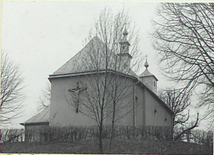
Dot. 2. Szczytu XI 78

12. Autorzy, historia obiektu, określenia stylu.