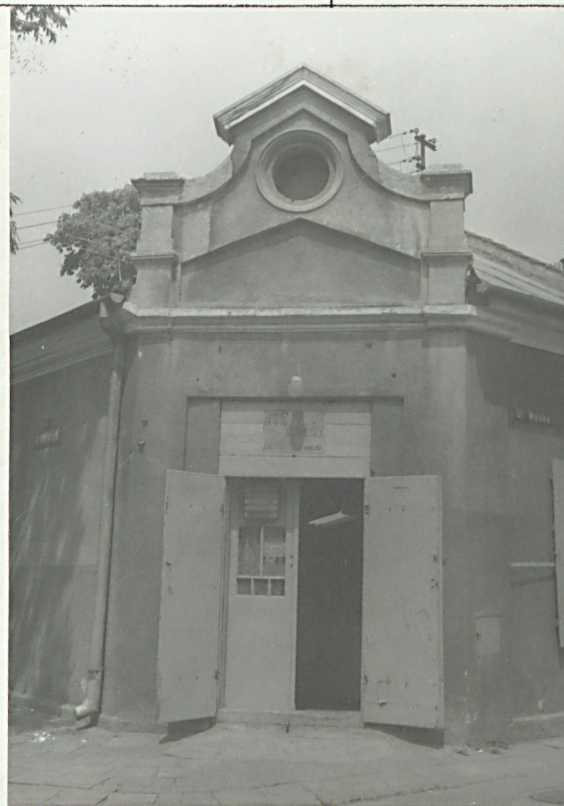
Widok od pd.