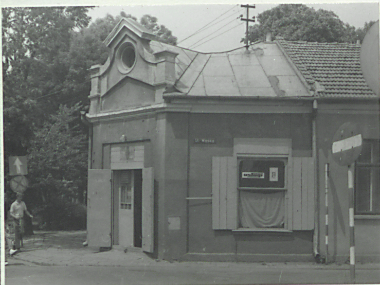
Widok od wsch.