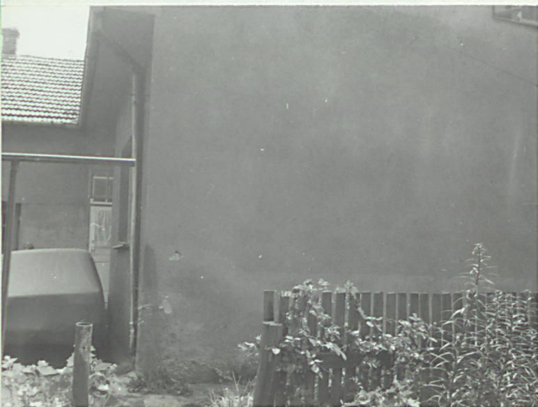
Widok od pn.