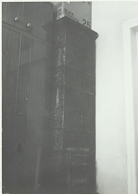
Piec w kuchni