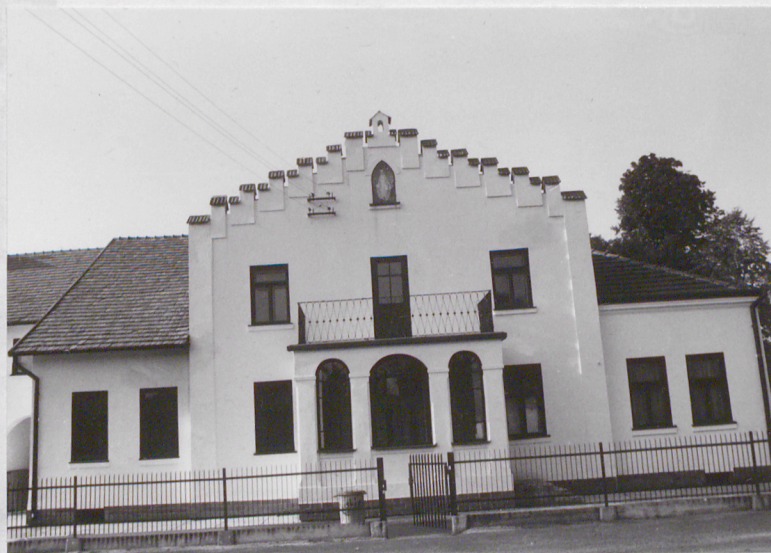
Widok od frontu

1. Miejscowość 2. Obiekt (nazwa jak w karcie) 3. Zawartość wkładki (nazwa obiektu lub materiału uzupełniającego) RZESZÓW /Osiedle Słocina/ Dom Parafialny parafii p.w. św. Rocha /ul. Paderewskiego/ c.d. opisu + rzut. poziomy + fotografie dodatkowe