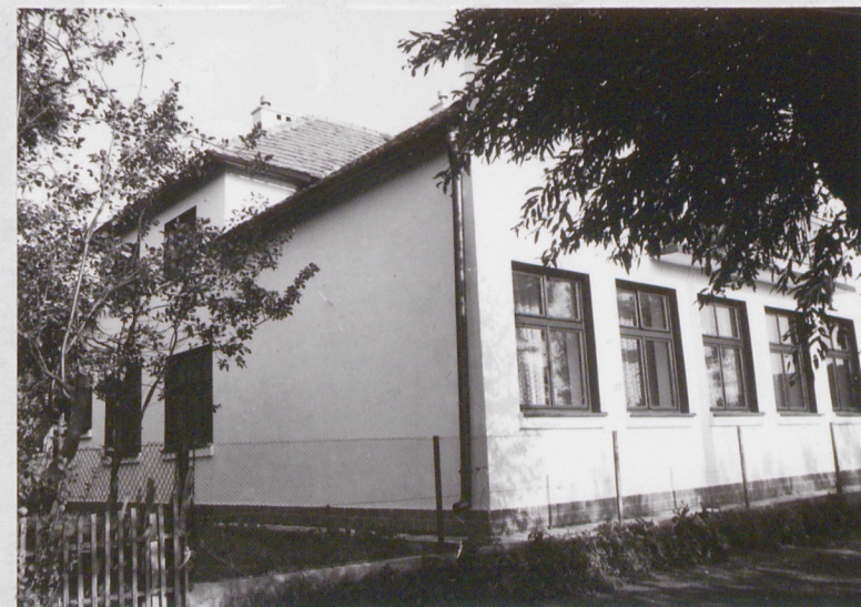
Część dobudowana od północnego-zachodu