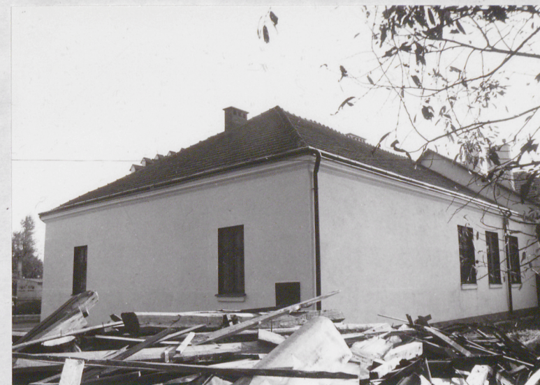
Widok od północnego-wschodu