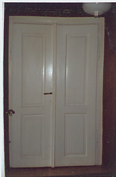
DRZWI DO POKOJU