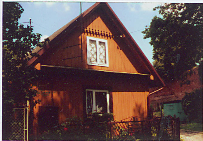
SZCZYT W ELEWACJI POŁUDNIOWEJ