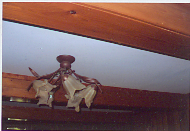
STROP BELKOWY W POKOJACH