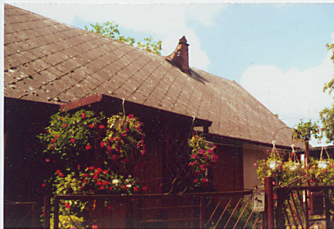
GANEK W ELEWACJI WSCHODNIEJ