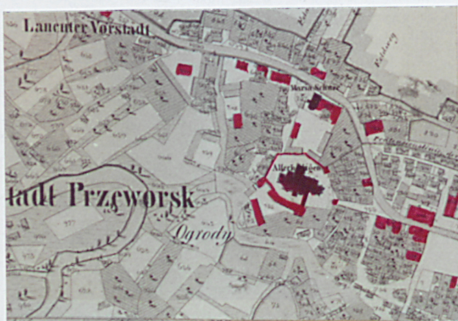
PRZEWORSK. MAPA KATASTRALNA Z 1848 CZĘŚĆ MIASTA Z KOŚCIOŁEM FARNYM