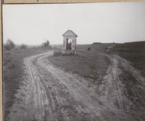
33. Uwagi różne