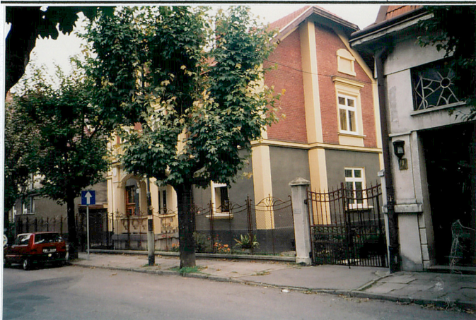
Elewacja południowa i zachodnia