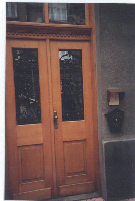
Drzwi wejściowe - główne