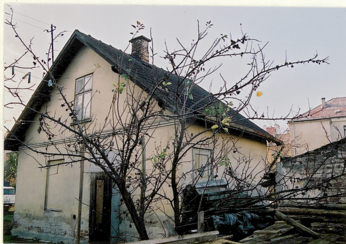
Elewacja frontowa i zach.