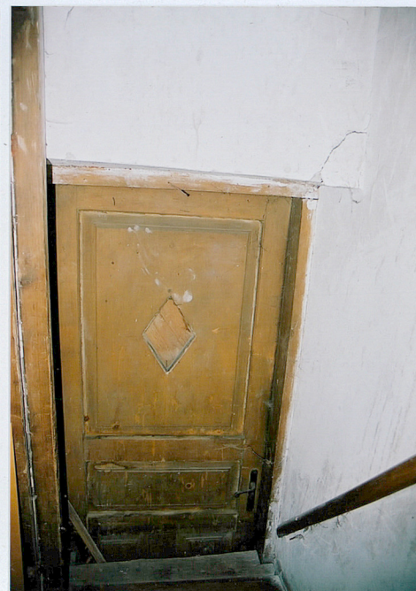
Drzwi wejściowe - boczne - widok ze schodów na strych