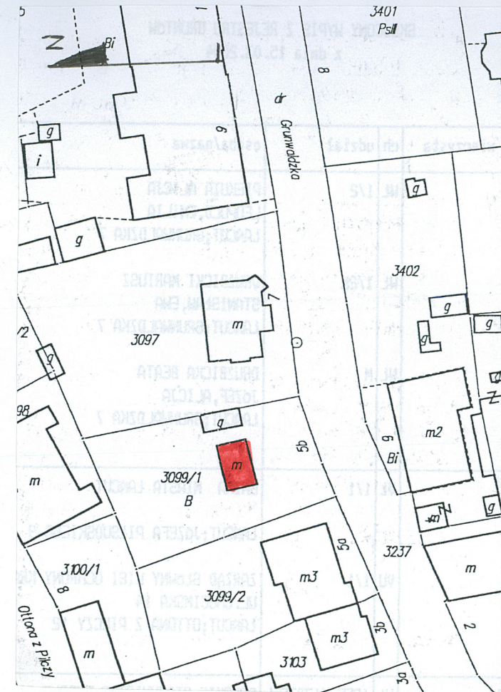
sytuacja skala 1:1000