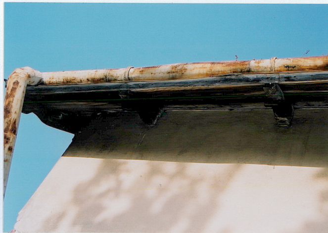
Okrap boczny dachu Okrap szczytu ↗