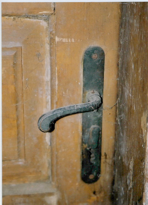
Klamka drzwi wejściowych - bocznych