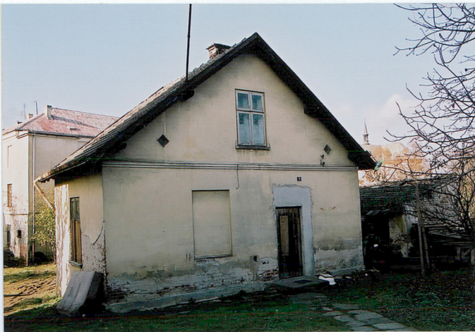
Elewacja frontowa i wsch.