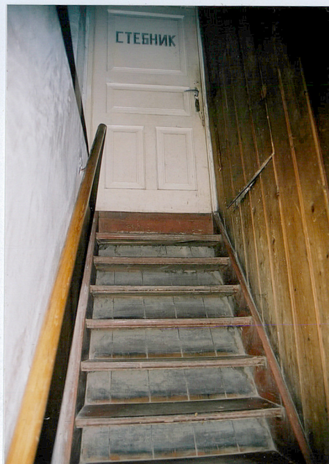
Schody na strych