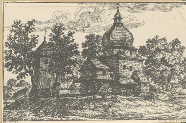
widok z r. 1837 w/g Kielisńskiego

A black and white photograph of a wooden bell tower with a pyramidal roof and a stone cross in the foreground. The tower is constructed of vertical wooden planks and has two small, dark, rectangular openings on its upper level. It is situated in a wooded area with dense foliage in the background. In the foreground, a stone cross stands on a rectangular base. The cross is made of light-colored stone and features a simple Latin cross design with a smaller crossbar. The base of the cross has some inscriptions, though they are not clearly legible. The overall scene is peaceful and rural.