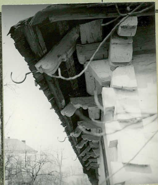
36. Wypełnił dnia

dom z placem w celu wreb- nie domu i zbudowania no- wego, murowanego.