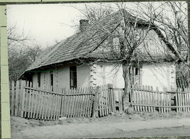
35. Uwagi różne

Od ulicy dach na- crollesany z potnery- tem dolnym, pis- nars oderlesany i podkreslony dan-kiem skupany. Da- nek i skupy warte na nadwiesionych plot arsch micsomyle pner ordobnie nyzde nyzie i ostanki trawary.