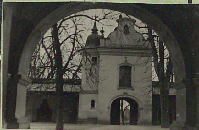
Bibl. Przewodnik po barfice do Bernardynów w 1938 r.