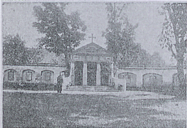
Каплиця св. Йосафата (1923)