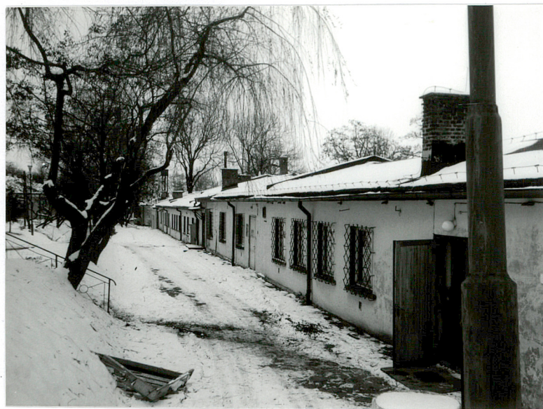
Widok ogólny elewacji północnej

11. Zdjęcia rzut przekrój sytuacja orientacja