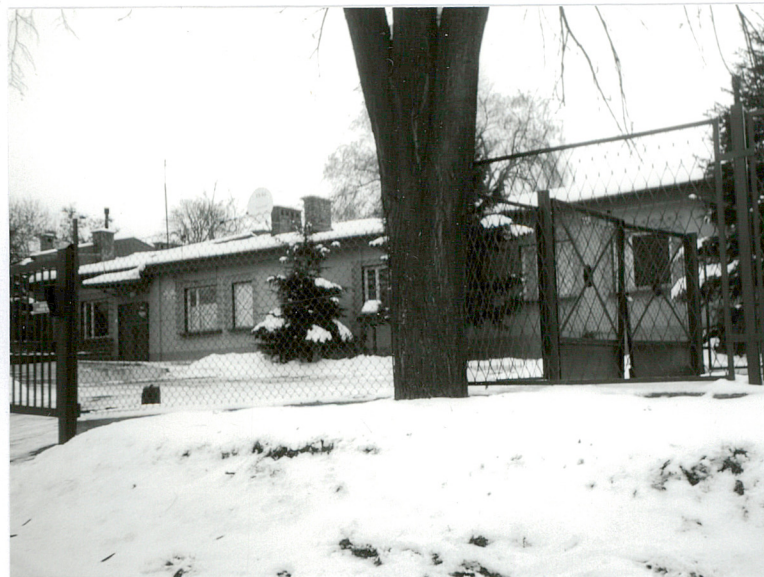
Widok środkowej części budynku od strony południowej