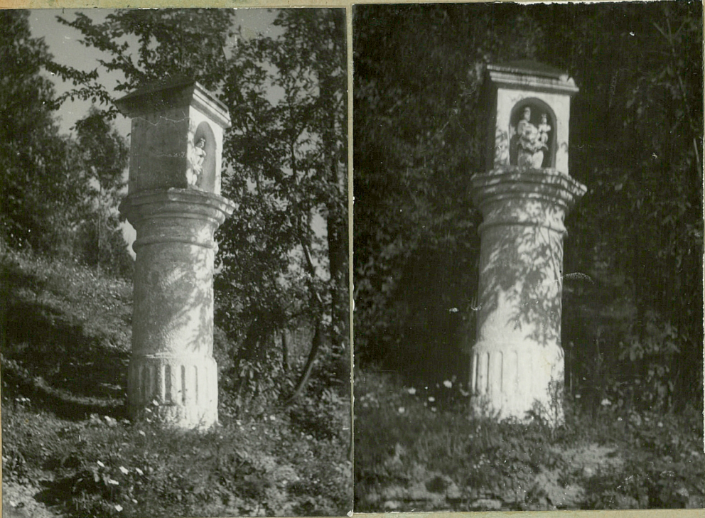
31. Szkic artystyczny, plan schematyczny, uwagi opisowe, fotografia

Kapliczka słupowa usytuowana na pochy- -łości wznoszą przy drodze Główna-U- -mieścia. Kuta z piaskowca, w kształcie ko- -łumny o okrągłym tronie gładkim na kanelowanej w połowie bazie. Głowica kolum- -ny toskańska przykryta osmioboczna pły- -tą, na której ustawiona jest kuta kaplicz- -ka sześcioramienna o gładkich ścianach, kwad- -ratowa, zwieńczona profilowanym grym- -sem, zakończona namiotowo. Od frontu wny- -ka półkolistą sklepioną kolebkowo, bez ramiaka.