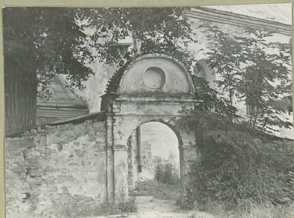
Fot. 1. Bramka od Str. plebanii.

Usytuowana u muru okalającego cmentarz kościelny od Str. pod-rach., stanowi przepiękny z dziedzińca kościelnego na teren plebanii (obecna nowa). Murovana, łukowana, klasycystyczna z ogólnym wystrój i półkolistym szczytem. Stanowi całość jednolitego zadziwienia wraz z drewnianą i kaplicą wkomponowaną w ten sam mur cmentarna kościelny.