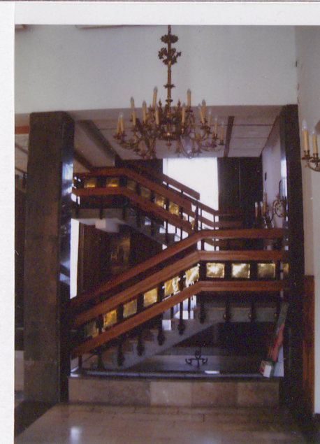
Wnętrze – współczesna klatka schodowa