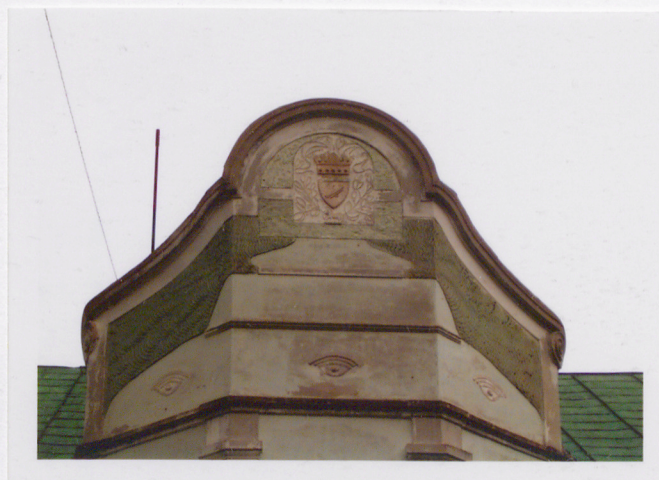
Zwieńczenie elewacji południowej