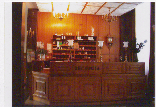
Wnętrze – recepcja

Wkładkę założył: Anna Mazurek, październik 2004 Miejsce przechowywania negatywów: u autora