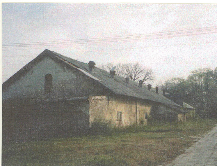
Widok od ptn.-zach.