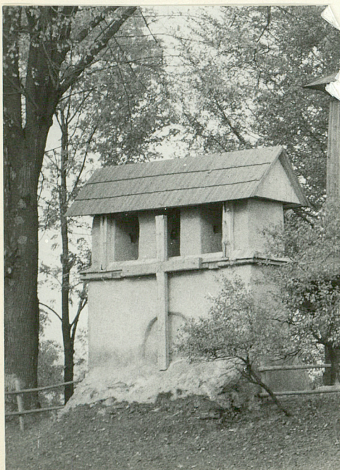
IX 78