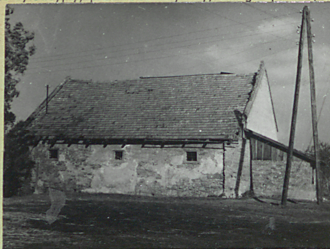
31. Szkic sytuacyjny, plan schematyczny, uwagi opisowe, fotografia