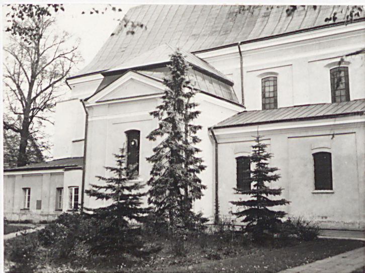
Widok na północną elewację kościół