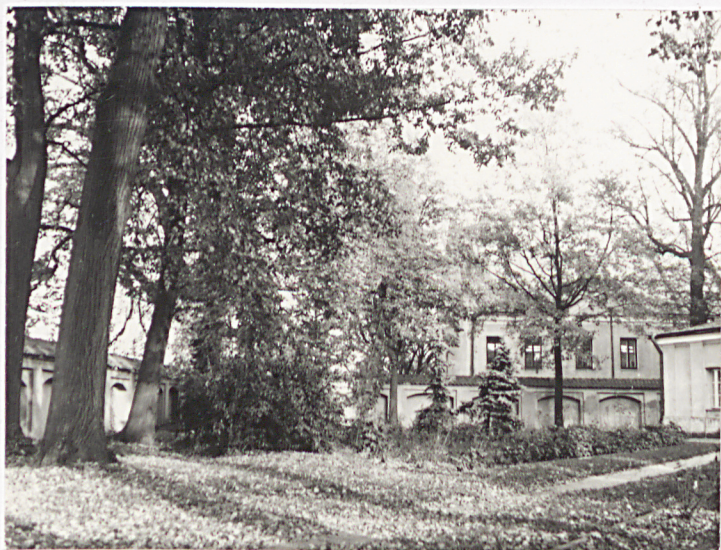
Teren d.cmentarza Widok z zachodu na północno-wschodni narożnik