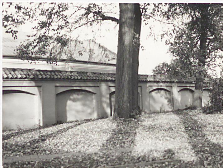
Murowane ogrodzenie stano- wiące północną granicę d.cmen- tarza. Widok od południa.