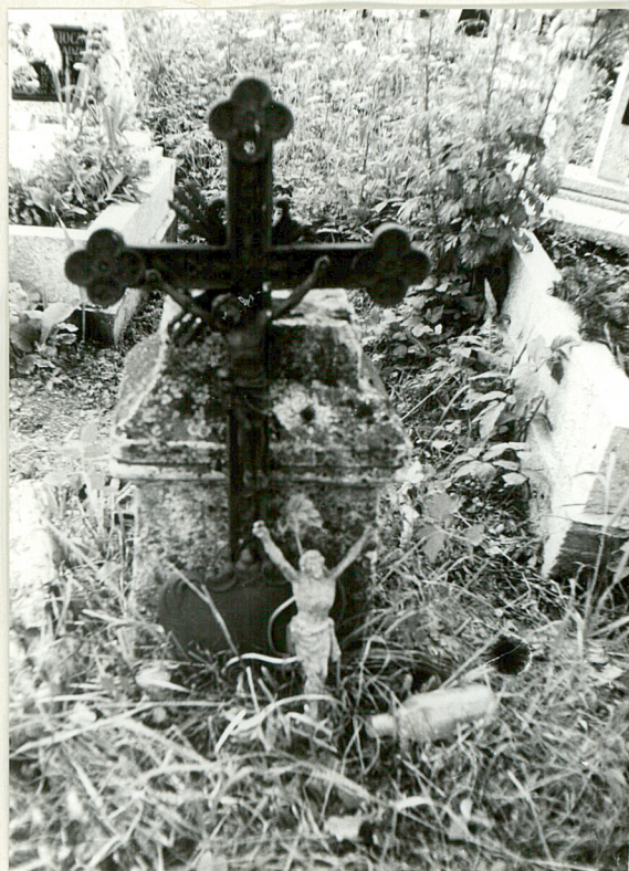
4. Nagrobek uszkodzony /napisów brak/ k. XIX w.