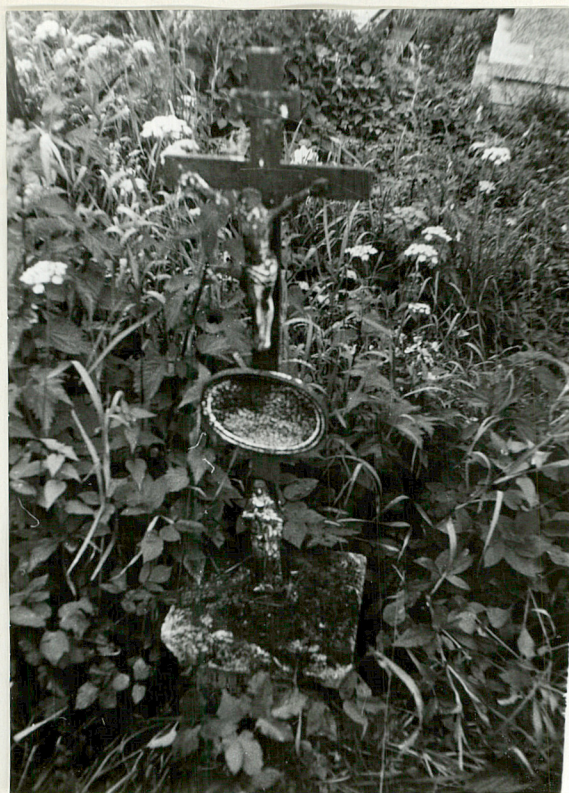
9. Nagrobek z krzyżem żel. /napis nieczytelny/ k. XIX w.