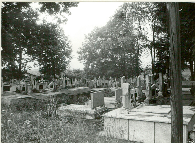
1. Widok ogólny