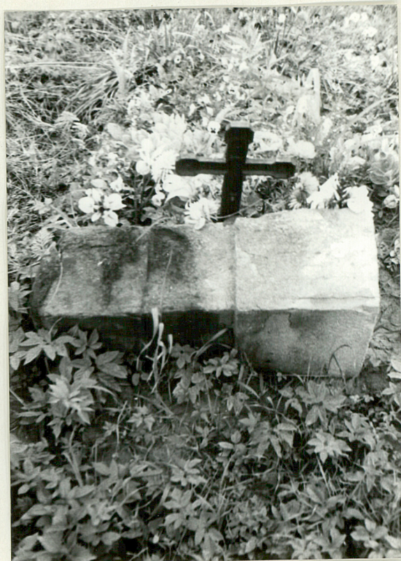
18. Nagrobek uszkodzony /napisów brak/ k. XIX w.