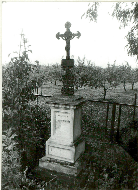
8. Nagrobek z krzyżem żel. Walenty ...? + 1901r.