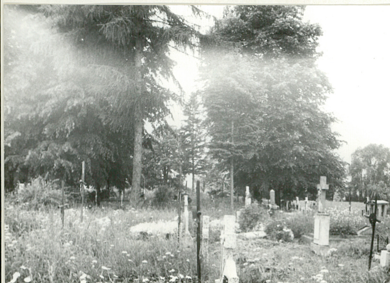
13. Widok ogólny