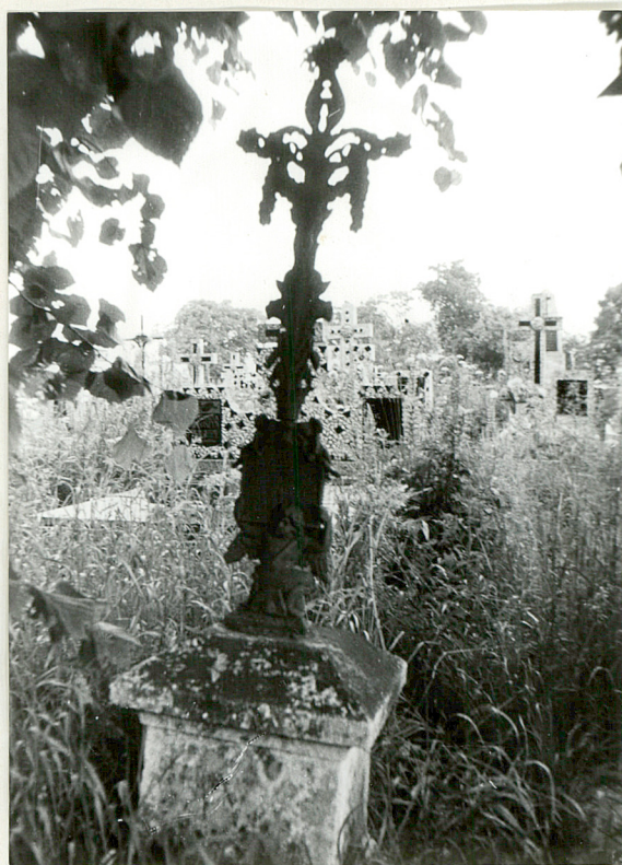
10. Nagrobek z krzyżem żel. /napisów brak/ k. XIX w.