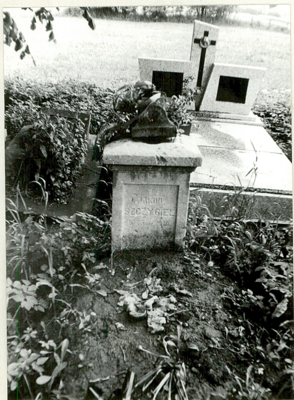
3. Nagrobek kamienny Jakób Szczygiel + 1910r.