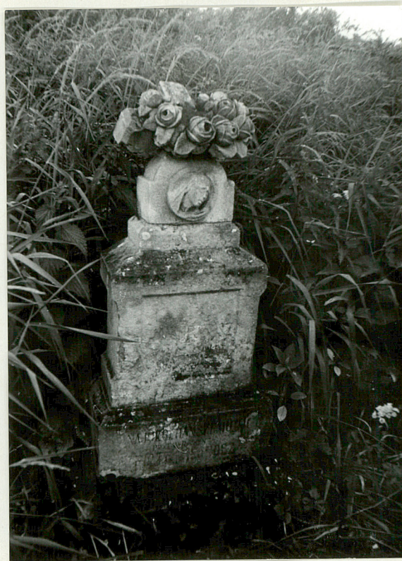
6. Nagrobek kamienny /napis nieczytelny/ k. XIX w.