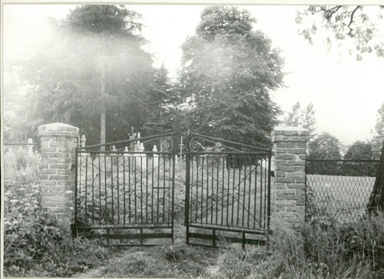
15. Brama metalowa