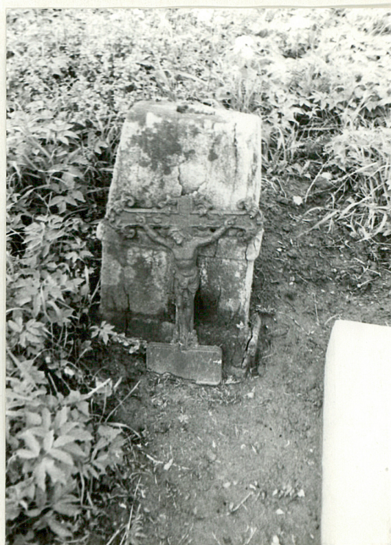
16. Nagrobek uszkodzony /napisów brak/ k. XIX w.