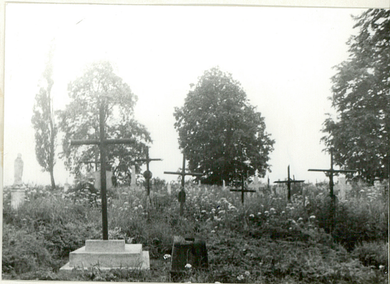
14. Widok ogólny