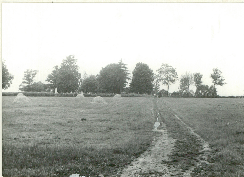
19. Widok od kościoła.