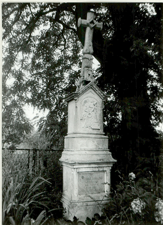
7. Nagrobek kamienny Tomasz Kowalski + 1889r.